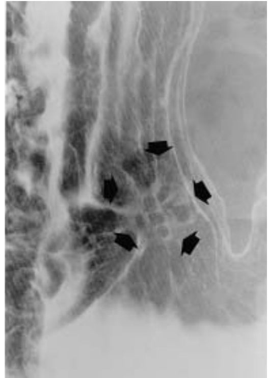
図78 b 病変部拡大像