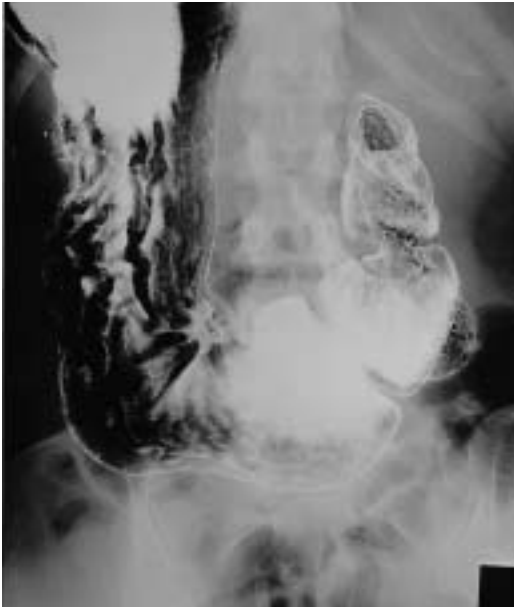
図78 a 腹臥位正面二重造影像